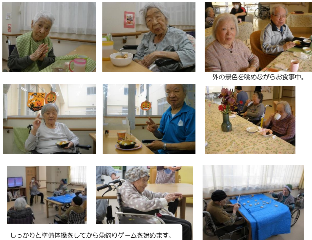
しっかりと準備体操をしてから魚釣りゲームを始めます。