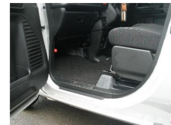
座席からの乗り降りが楽との声も。